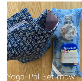
Yoga-Pal Set mbw

beinhaltet: Yoga Pal m, Augenkissen simple Bourette (Seide), Räucherdösli oder Dufthüter, petit surprise